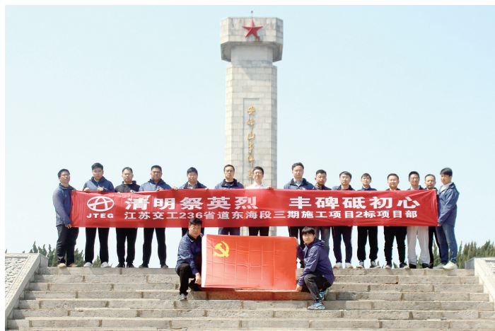
缅怀魂，念初心。

腾龙大道7标临时党支部组织党员同志、团员青年，一起前往瞿秋白纪念馆，开展了一场缅怀革命先烈，传承革命精神的红色教育活动。在讲解员的引导下，大家依次参观了瞿秋白故居和瞿秋白纪念馆，对常州三杰之一瞿秋白先生的生平经历和革命事迹有了更深刻的了解，真切感受到瞿秋白同志为党为民、守誓践诺的至诚精神。党支部书记勉励大家，将此次参观教育活动的收获转化为工作动力和生活态度，以实际行动践行党的宗旨。