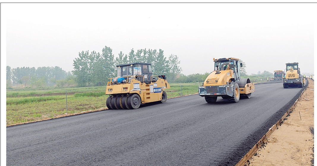
422省道施工建设取得新突破

操作手册,并在实际工程中得到示范应用,课题取得了多项成果,有助于解决公路桥梁盆式支座更换滑板的行业性难点痛点问题。该课题还入选了江苏省交通运输厅2023年度重点科技项目清单。